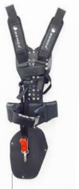
Arnés acolchado profesional